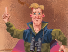
RUDOJO LOKIO PĖDSAKAS

Labiausiai lokiams patinka Lietuvos miškai ties Biržais , Ignalina ar Švenčionimis . Jei kartu su tėvais nuspręsite leistis ieškoti rudojo lokio pėdsakų, tikėtina, kad pavasarį jo buvimo ženklų užtiksite šioje miškingoje vietovėje: